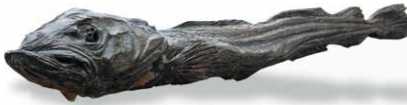
“KONGETORSK” LAGET AV ALESSANDRO PAVONE (ITALIENSK TREKUNSTNER), 2011. 7,5 METER LANG, UTSTILT PÅ BAKRE DEL AV BRYGGEN.

ETTER TREKNING OG SAMTALER, SYNGES «DEILIG ER JORDEN» OG VI ØNSKER HVERANDRE EN GOD JUL